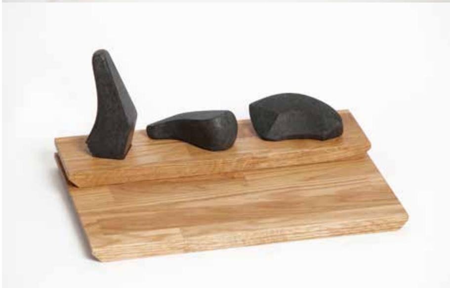
Stone Tools | Utensilios de cocina Granito negro y roble | 2010 Produce Postfossil